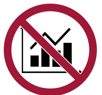
Realizar tareas estadísticas deportivas de cualquier tipo

Esta lista no es exhaustiva Más información en www.fcbarcelona.cat