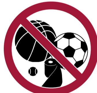
Objetos que puedan ser lanzados