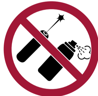
Punteros láser y aerosoles