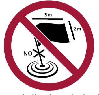
Palos y mástiles de cualquier tipo, banderas y pancartas de máximo 2x3m (ofensivas de cualquier medida)