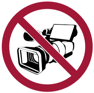
Grabar vídeos, imágenes y audio con equipos profesionales y/o acceder con ellos