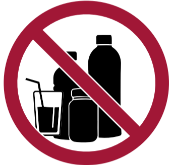
Envases / recipientes rígidos y de capacidad superior a 500ml (tapones retirados en cualquier caso)