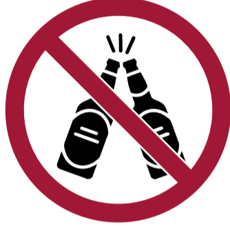
Bebidas alcohólicas o estar bajo los efectos