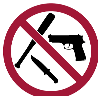
Armas y objetos contundentes