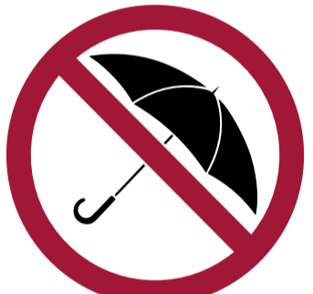
Paraguas y parasoles