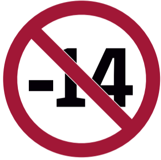
Acceso a menores de 14 años sin ser acompañado por un adulto