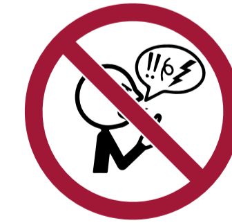
Expresiones que inciten a la violencia, xenofobia, racistas e intolerantes