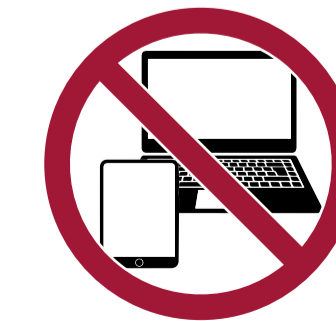
Ordenadores y tablets