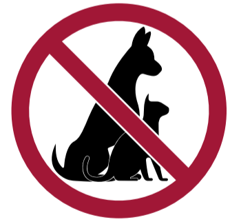
Mascotas (excepto perros guía)