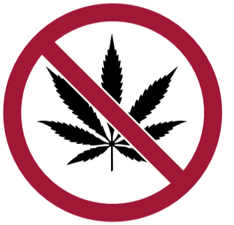
Drogas o estar bajo los efectos