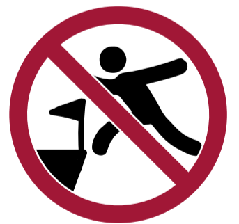
Invadir el terreno de juego