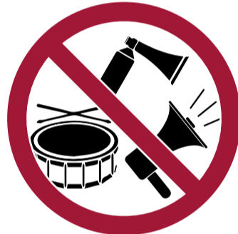
Instrumentos sin autorización, bocinas y megáfonos