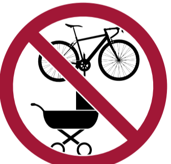
Cochecitos de bebé, patinetes, monopatines y bicicletas