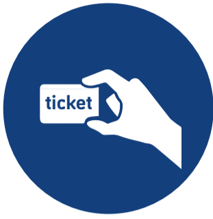
Enseñar el tiquet de entrada cuando se solicite