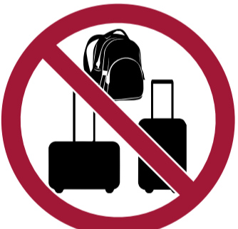
Maletas, equipaje de mano i mochilas