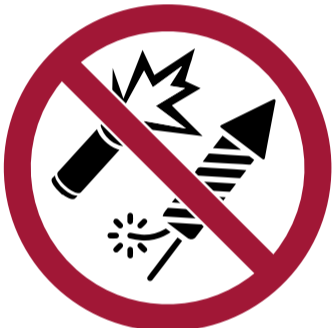
Bengalas y fuegos artificiales