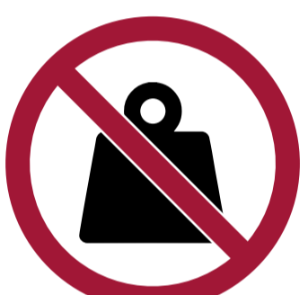
Objetos superiores a 500g