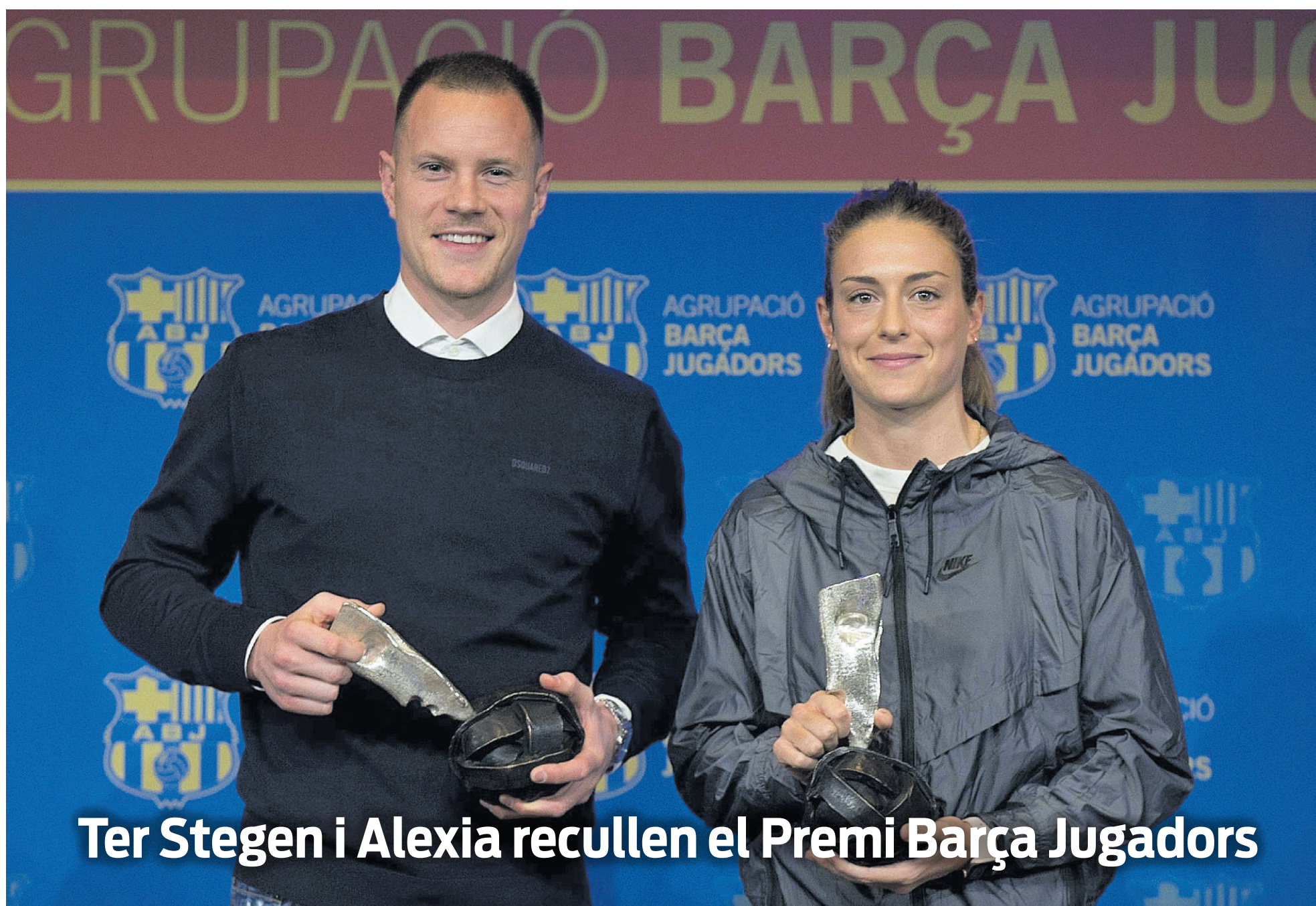
Ter Stegen i Alexia recullen el Premi Barça Jugadors