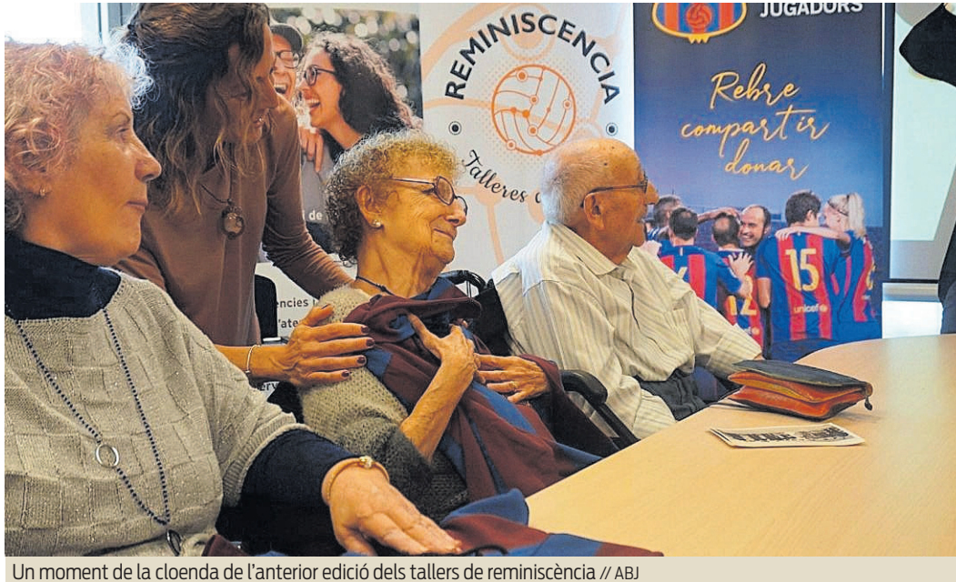
Un moment de la cloenda de l'anterior edició dels tallers de reminiscència

ACTIVITATS LÚDIQUES Els tallers estan organitzats en 12 sessions de dues hores cadascuna on es treballen diferents aspectes cognitius com, per exemple, l'exercici de la memòria a través d'activitats lúdiques relacionades amb el futbol i la història del Barça.