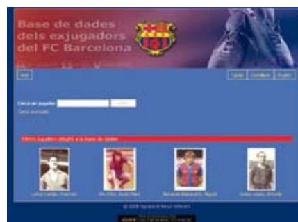
5. Pàgina d'entrada a la base de dades on-line de jugadors del FC Barcelona.